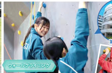
ウォールクライミング