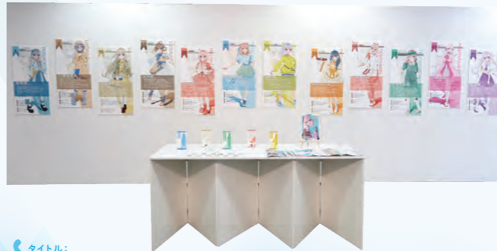
タイトル: Kampo Cure Maidens ～キミに効くのは誰?～ デジタルプリント (縦900mm×横450mm)、Adobe Illustrator、CLIP STUDIO PAINT