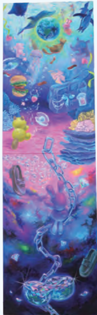
タイトル: 今までとこれから。 キャンバス (M100号)、油彩