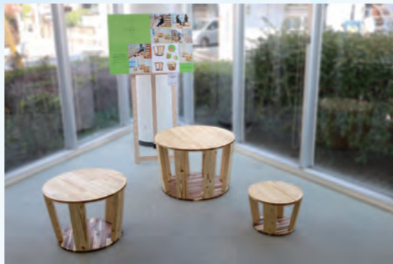
タイトル: 共に、過ごす パイン材、パイン集成材、アカシア集成材、木ダボ、リンシードオイル