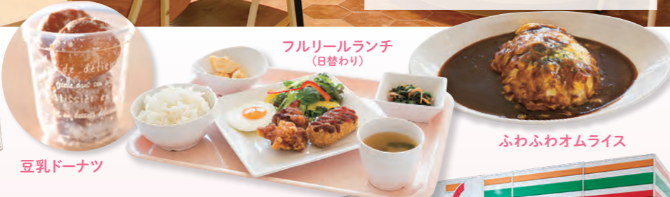
フルリールランチ (日替わり)