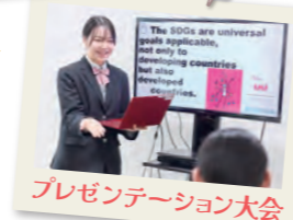
プレゼンテーション大会