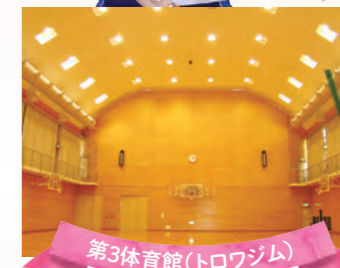
第3体育館(トロワジム)