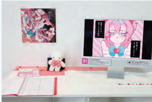
タイトル: PayN dream デジタルプリント (縦300mm×横300mm)、Adobe After Effects、ibisPaint、ポア生地、綿、その他