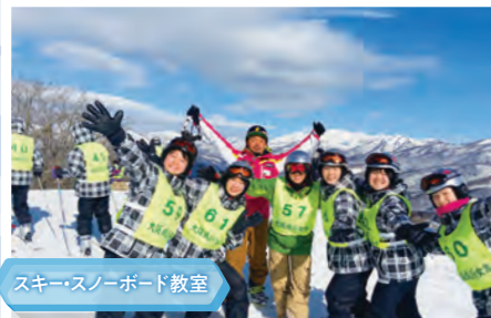
スキー・スノーボード教室