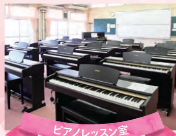
ピアノレッスン室