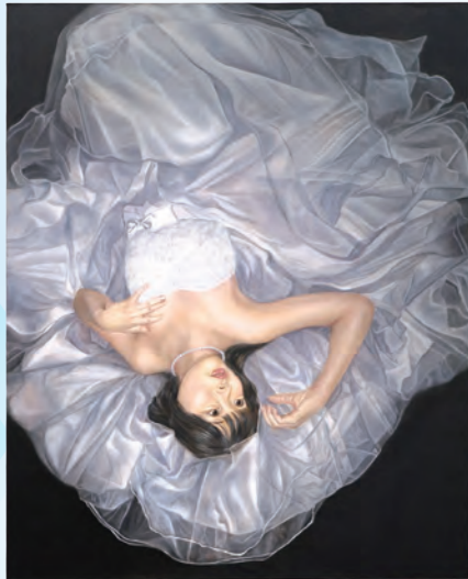
タイトル: 「憧れ」と「希望」 キャンバス (F100号)、油彩