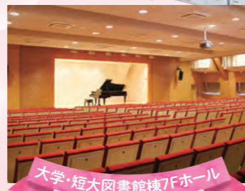
大学・短大図書館棟7Fホール

蔵書5万冊以上、コンピュータ検索システムと閲覧しやすい開架式で、充実した図書室です。