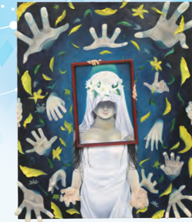
タイトル: 秘密 キャンバス (F100号)、 油彩、粘土、顔料