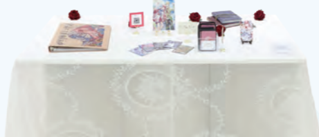
タイトル: 天秤上の花言葉 デジタルプリント (A1判、AO判)、CLIP STUDIO PAINT、ibisPaint