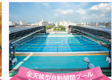
全天候型自動開閉プール