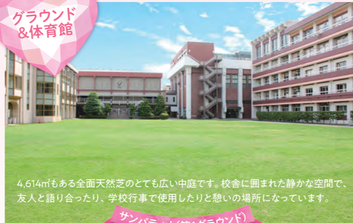
グラウンド & 体育館

4,614㎡もある全面天然芝のとても広い中庭です。校舎に囲まれた静かな空間で、友人と語り合ったり、学校行事で使用したりと憩いの場所になっています。